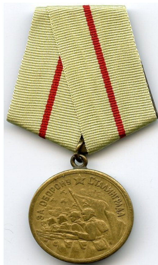
Приложение №7 Наградной лист. Описание подвига Федотова Петра Федоровича